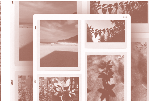
LUGARES DONDE PASAN COSAS. SÁBADO 25