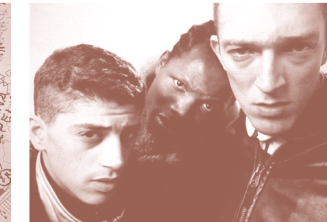
LA HAINE. MATHIEU KASSOVITZ. JUEVES 30