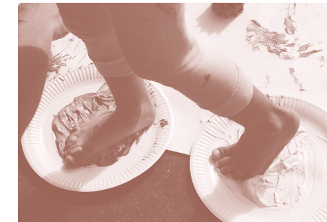
EL SUBMARINO ROJO. MIÉRCOLES 14