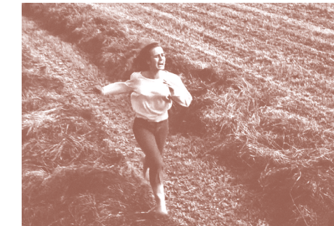
PEAUX DE VACHES. PATRICIA MAZUY. JUEVES 23