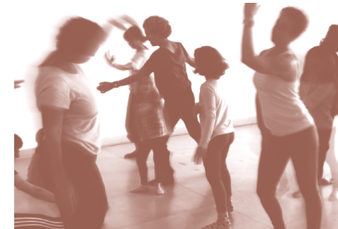
KAMELEOIAK GARAI TALLER DE DANZA PARA FAMILIAS. S. 04