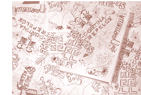
ATLAS – PLAKA. MIÉRCOLES 29